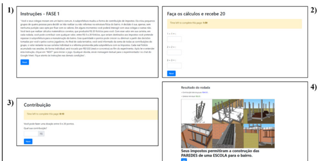
Figura 1. Telas Apresentadas aos Participantes nas Quatro Etapas de cada Tentativa do Procedimento Experimental